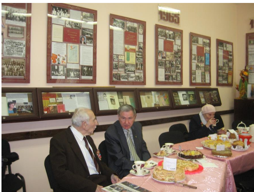
- проводил работу с ветеранами педагогического труда