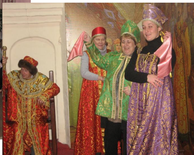
На экскурсии в Александровской Слободе